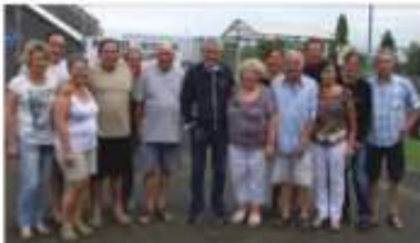
Claude Lelouch est venu saluer l'équipe de bénévoles du club de