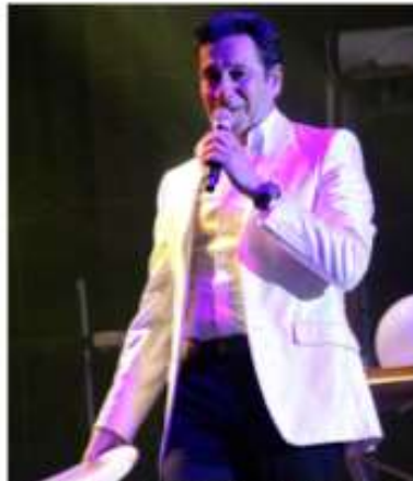
Ici avec la voix et l'allure d'Héroï Salvador, Laurent Gerra entame un show qui n'épargne aucun de nos hommes politiques. Le public jubile.