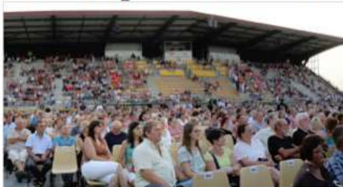
Il est 20 h, les Lyonnais en cœur viennent d'entrer en scène. Les spectateurs s'installent peu à peu. À 21 h 30, lorsque Laurent Gerra d'est la main sur le cœur qu'il salue le public bressan... Du plus exactement le public de "Louhans" comme le dit si bien Johnny.