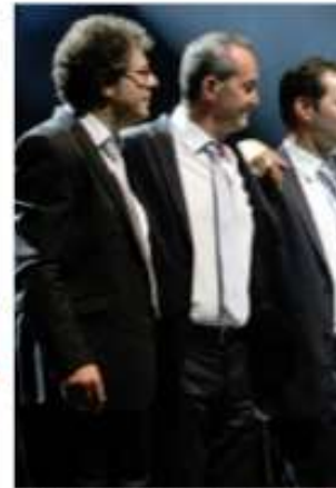
L'orchestre de Fred Manspikian accompagne Laurent Gerra. La complicité qui unit cet ensemble est palpable. L'émotion est palpable.