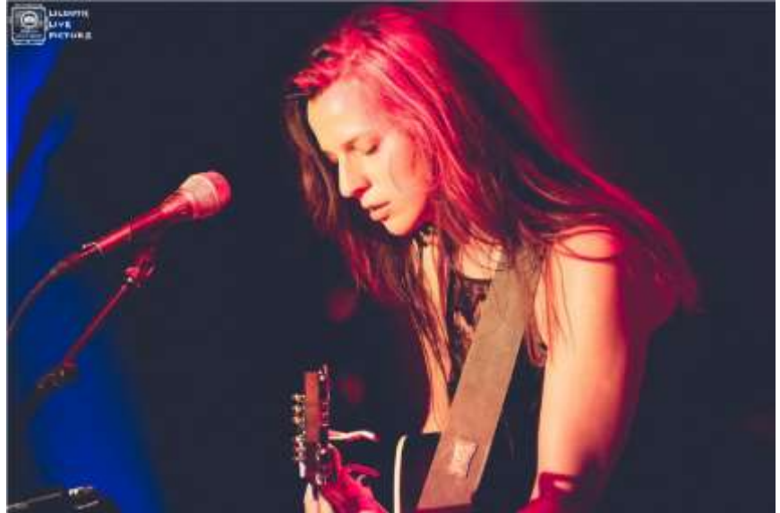
La chanteuse, finaliste de la 1ère saison de « The Voice » en 2012, sort son 2ème album.

L'auteur-compositriceinterprète de Montigny-lèsCormeilles présentera une partie de son second album Samedi 7 Octobre, à 15h30, au magasin Cultura de Franconville.